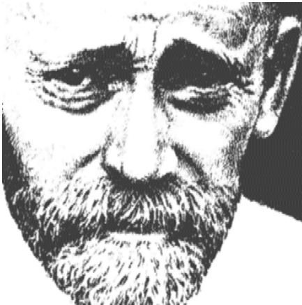
Abb.: Portrait Janusz Korczaks

In Kaltenkirchen erinnert seit dem Jahr 1985 die Janusz-Korczak-Schule, Förderzentrum mit dem Schwerpunkt Geistige Entwicklung, an den polnisch-jüdischen Pädagogen, Arzt, Wissenschaftler und Schriftsteller aus Warschau.