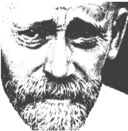
Abb.: Portrait Janusz Korczaks

In Kaltenkirchen erinnert seit dem Jahr 1985 die Janusz-Korczak-Schule, Förderzentrum mit dem Schwerpunkt Geistige Entwicklung, an den polnisch-jüdischen Pädagogen, Arzt, Wissenschaftler und Schriftsteller aus Warschau.